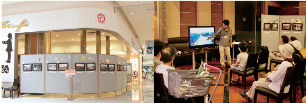
現在はスターバックスの場所で、約50枚の守谷町の写真を展示と発表会

2011年7月、ロックシティ守谷(現イオンタウン守谷)で「面白もりや町写真展」を開催。11日間に渡り「ちょっと昔の守谷町」の写真を展示しました。この写真展が、守谷で独立してはじめての企画でした。