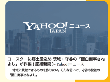
もりやコースター(9cm四方)に郷土愛をつめこみました