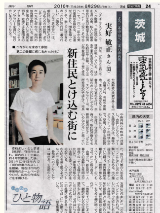
2016年 新住民とけ込む街に

これまでの地域活動で学んだことは、多様な「視点」や「発想」を尊重し合い、誰もが「発言」できる場をつくることの大切さです。これからも、誰もが地域につながる「守谷のまちづくり」に貢献していきたいと思ひます。