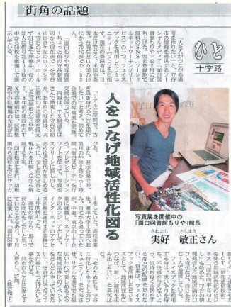
人をつなげ地域活性化図る